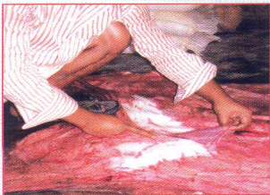
চামড়ার গায়ে লেগে থাকা চর্বি মাংস কেটে ফেলতে হবে।