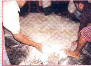
চামড়ার ফ্লেস সাইডে লবণ প্রয়োগ করতে হবে।