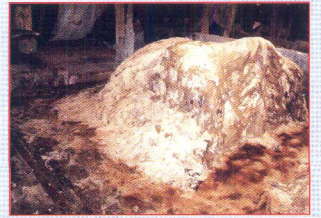
সংরক্ষিত চামড়া সামান্য ঢালু জায়গায় স্তুপীকৃত করতে হবে।