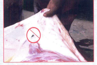
বাঁকানো মাথার ছুরি ব্যবহার না করলে সহজেই লেস্-কাট হতে পারে।