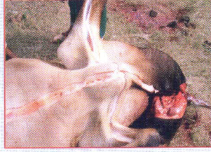
চামড়ায় লম্বালম্বি কাটা স্থান।