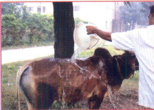
জবাই এর পূর্বে পশুকে পানি দ্বারা ভালভাবে পরিষ্কার করে শুকিয়ে নিতে হবে।