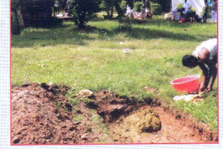
গর্তে গোবর ও অন্যান্য ময়লা রাখতে হবে।

আসুন আমরা চামড়ার যত্ন নেই ও দেশের অর্থনীতি শক্তিশালী করি।