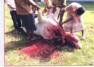
গর্ত করা না হলে চামড়ায় রক্ত লাগবে ও পরিবেশ দূষণ হবে।