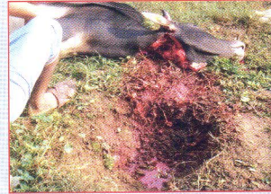
জবাই এর স্থানে একটি গর্ত করতে হবে।