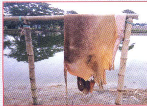
পরিষ্কার করার পর চামড়া থেকে পানি ঝড়িয়ে নিতে হবে।