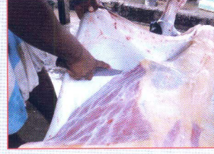
চামড়া ছাড়ানোর পদ্ধতি।